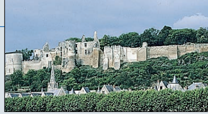
Le château de Chinon

Jeanne d'Arc est née en 1412 à Domrémy, un petit village de Lorraine. À cette époque, la France était occupée par les Anglais. Un jour, Jeanne a entendu des voix. Elle a reconnu Sainte Catherine, Sainte Marguerite et Saint Michel. Ces voix lui ont dit: «Jeanne, c'est toi qui vas délivrer le pays!»